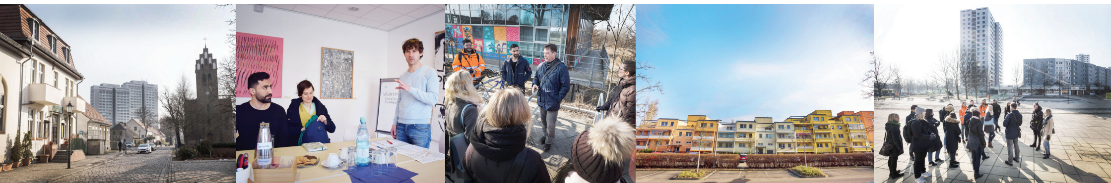
"Bra inblick i generella sociala utmaningar i stadsområden."

Detta studiesök fick mycket positiv respons, mycket med tanke på hur detta besök hjälpte till att uppfylla våra mål med resan. Detta för att området står inför liknande generella sociala utmaningar i en förort som vårt case-område. Att både få vistas i området och framförallt för att få en genomgång om arbetet på plats som gav en bra helhetsbild och bra tankar att jobba vidare med. Trots likheterna mellan Marzhan-Hellersdorf och vårt case-område var den generella upplevelsen från oss att förutsättningarna ändå skiljer sig en del, och att områdena står inför olika problem.