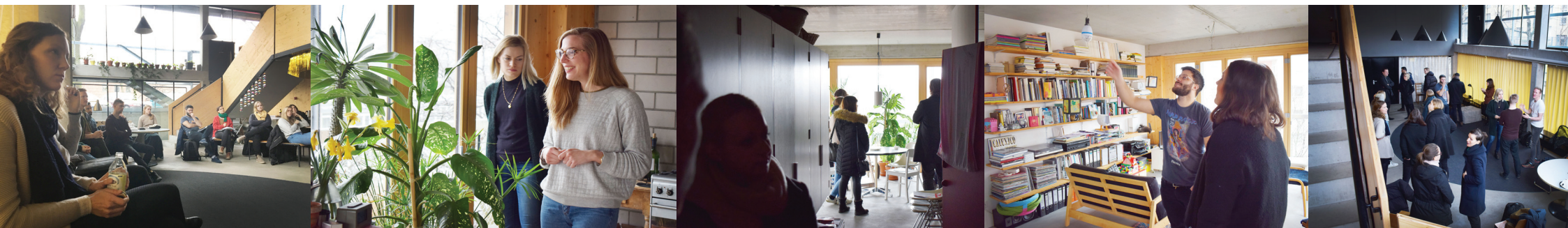
Intressant att se en byggenskap, något som det pratas mycket om i Sverige men inte än slagit igenom.

Många i gruppen fann det här besöket väldigt intressant, att få information om ytterligare en ny typ av boendeform samt att få vistas inne i byggnaden och lägenheterna. Gav bra inspiration till hur billiga materialval ändå kan ge ett fint och modernt intryck. Besöket resulterade i nya tankar om alternativa och mer öppna planlösningar samt hur gemensamma utrymmen kan skapas och nyttjas. Besöket väckte tankar om hur detta skulle kunna appliceras i Sverige i områden som har hög arbetslöshet och/eller sämre ekonomi.