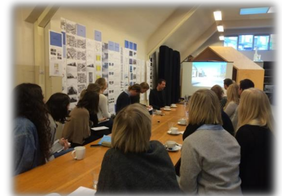
Gruppbild under presentationen.

yrkesrollen var däremot mer blandat även om majoriteten såg det som givande.