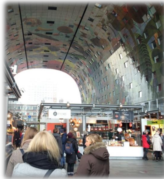
Inne i Markthal, marknadsstånd och lägenheter med fönster in mot marknaden.

bakgrundsbeskrivning om projektet innan, annars hade man lätt missat viktiga delar. Finansieringen och kombinationen marknad-bostäder-mötesplats var intressant för många. Många traineer anser därför att detta vara ett mycket värdefullt studiebesök som kommer att kunna bidra i det framtida arbetet, både inom traineeprogrammet och senare i yrkeslivet.