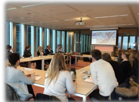
Föreläsning med diskussioner om södra Lindholmen.

Det avslutande studiebesöket på resan var det som, av flera, uppfattades som det bästa. Något som sågs som väldigt positivt var att föreläsarna kom väl förberedda till besöket samtidigt som de var väldigt intresserade av att hjälpa oss med vårt casearbete och ge oss deras syn på uppgiften. Från vårt besök fick vi med oss flertalet insikter som vi kommer att ha nytta av i det fortsatta casearbetet.