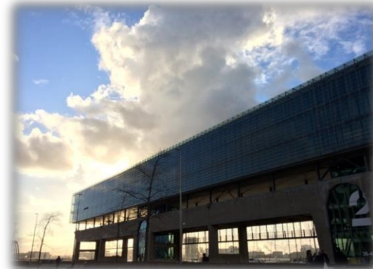
Exempel på ombyggnation av gammal uppställning för lyftkranar till kontor