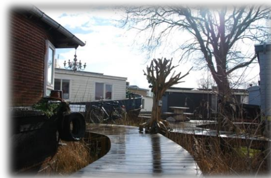
Gamla båtar ombyggda till kontorslokaler för att bevara kultur.