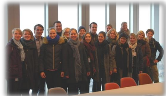
Gruppbild tillsammans med föreläsarna.