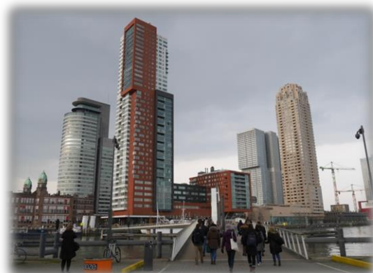
På väg tillbaka till Rotterdam centrum efter rundvandring i nya stadsdelar.