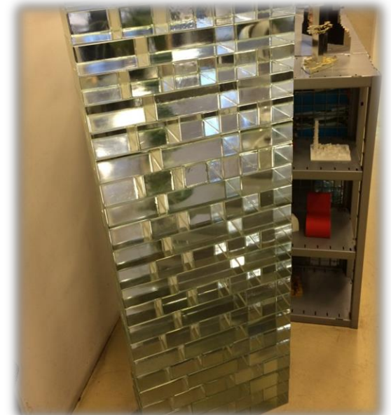
Tegel av glas, ett exempel från ett annat spännande projekt.