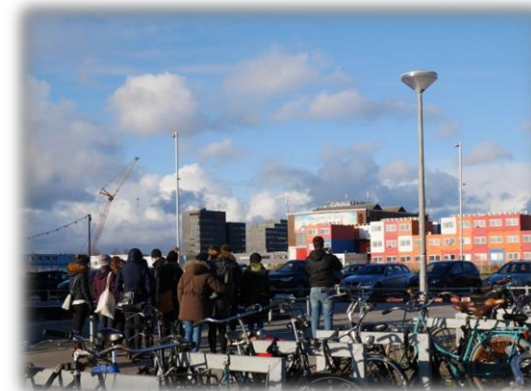
Gruppbild med utsikt över temporära studentlägenheter.

Studiebesöket uppfattades som väldigt positivt och fick bra omdömen i enkäten som följde efter resan. Överlag så tyckte de flesta att besöket var relevant för både casearbetet och den egna yrkesrollen. Det som uppfattades som särskilt positivt var att Gert Urhahn var så väl förberedd och hade ett stort engagemang både för oss och för sitt område, och att vi fick möjligheten att se genomförda tillfälliga lösningar och hur äldre industriområden omvandlats. Bland de saker som kunde gjorts annorlunda nämndes att studiebesöket blev lite väl långt och att det stundtals var svårt att hålla koncentrationen uppe även om det var väldigt intressant.