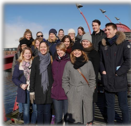
Gruppbild under rundvandringen. Bilden är tagen på en bro med mycket spännande utformning.

yrkesroller vi har. Engagemanget i gruppen upplevdes som bra och med tanke på den tidiga morgon med flygtider och annat var det bra att engagemanget ändå var högt. Vår enskilda förberedelse inför besöket hade kunnat vara lite bättre och tiden hade kunnat vara något längre.